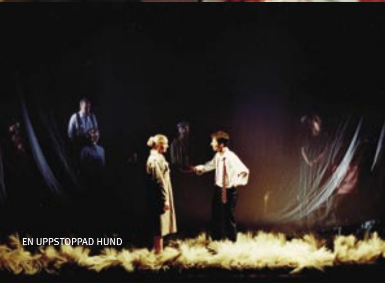
EN UPPSTOPPAD HUND