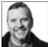
Greger Ottosson skådespelare