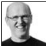
Cay Nyqvist kompositör