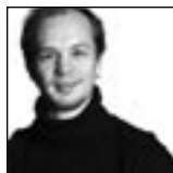
Peder Holm skådespelare